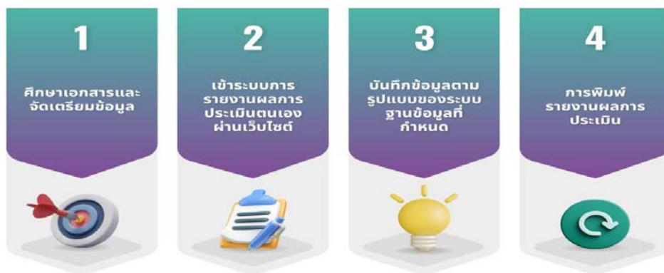
ภาพที่ ๖.๑ การรายงานผลการประเมินตนเองผ่านระบบออนไลน์